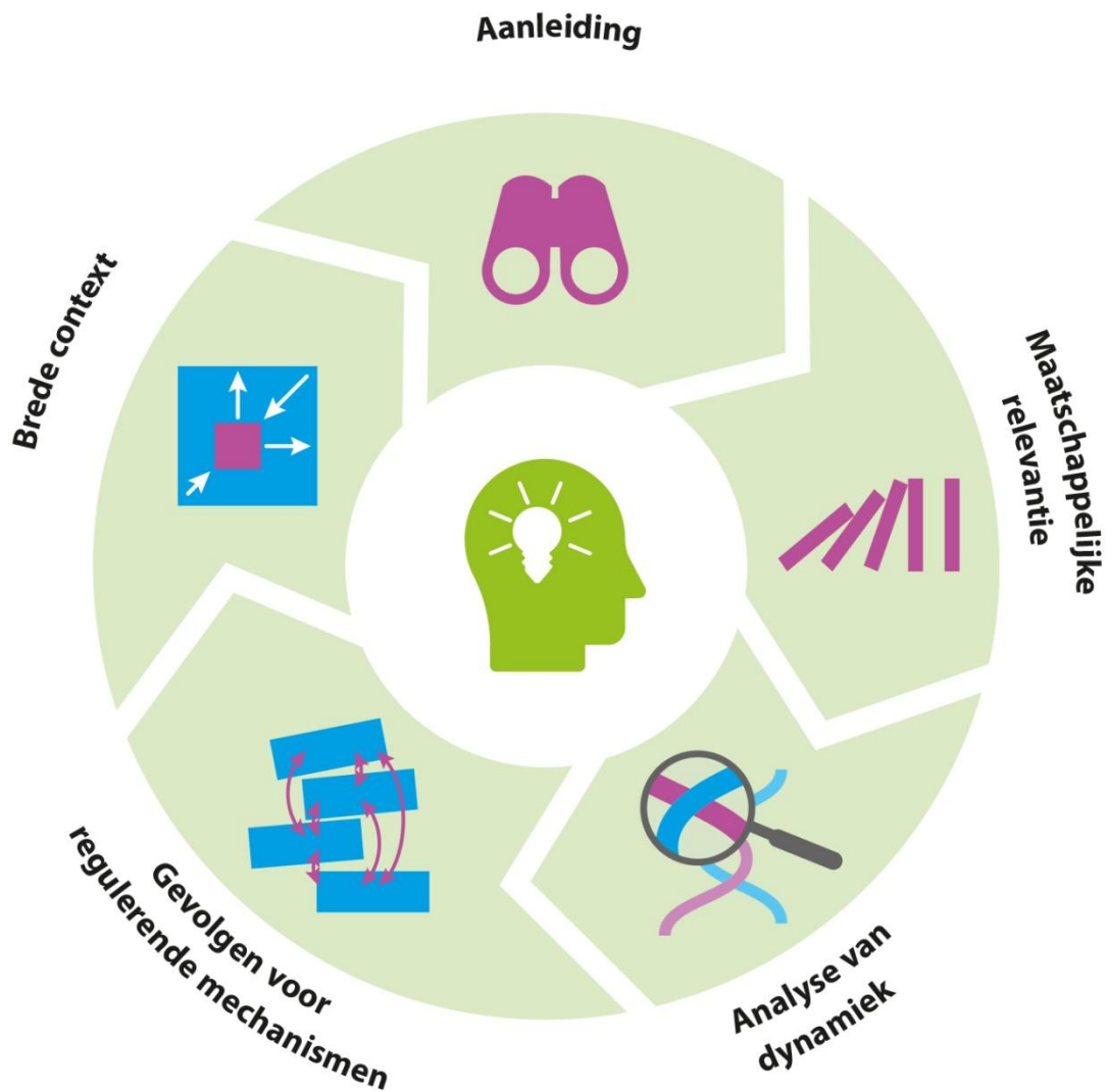
Figuur 3: Analytische beoordelingscyclus voor technologische ontwikkelingen