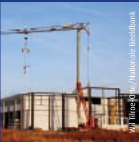
Wij Tiroe Oite/Nationale Beeldbank

De raden hopen dit advies in 2012 uit te brengen.