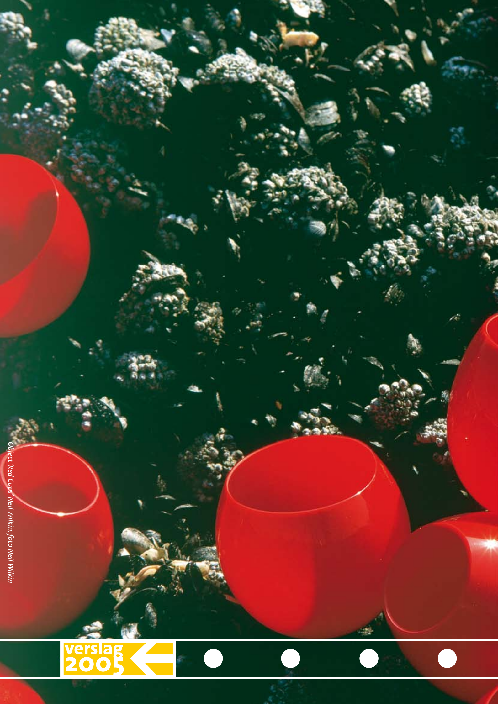
Object 'Red Cups' Neil Wilkin