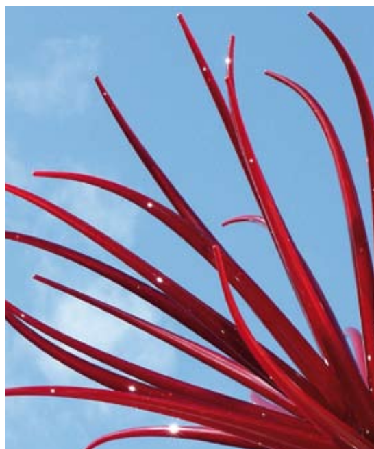
Object 'Red Flower 1999' Neil Wilkin, foto Neil Wilkin

De raad heeft nog geen reactie op het advies ontvangen. De behandeling in de Kamer van de landbouwvisie staat geagendeerd in april 2006. De vaste Commissie heeft de minister gevraagd om tevens expliciet een reactie te geven op dit advies.