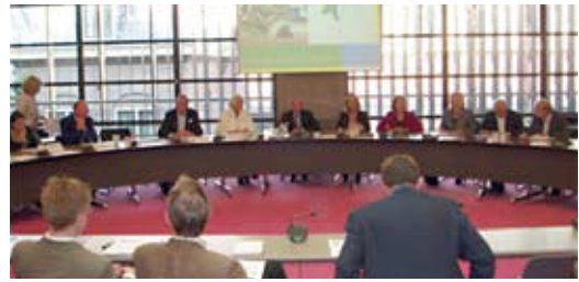
Aanbieding van het advies 'Kies positie in transitie' aan de Tweede Kamer op 5 oktober 2005

In het advies constateert de raad dat inkomens in het landelijk gebied niet wezenlijk verschillen van inkomens in het stedelijk gebied. De economische perspectieven in sommige agrarische sectoren daarentegen zijn beperkt. Het is nog niet aan te geven in hoeverre de huidige investeringen van overheden en particulieren oplossingen bieden voor de specifieke landbouwproblematiek op het platteland. Wel is duidelijk dat voor natuur, landschap en recreatie voldoende overheidsmiddelen ontbreken waardoor de maatschappelijk gewenste kwaliteitsverbetering achter blijft.