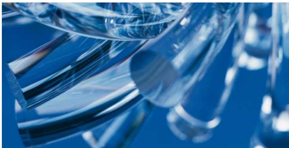
Object 'Croscosmia' Neil Wilkin, foto Taco Anema

Deze vier adviezen staan kort omschreven in hoofdstuk 2.