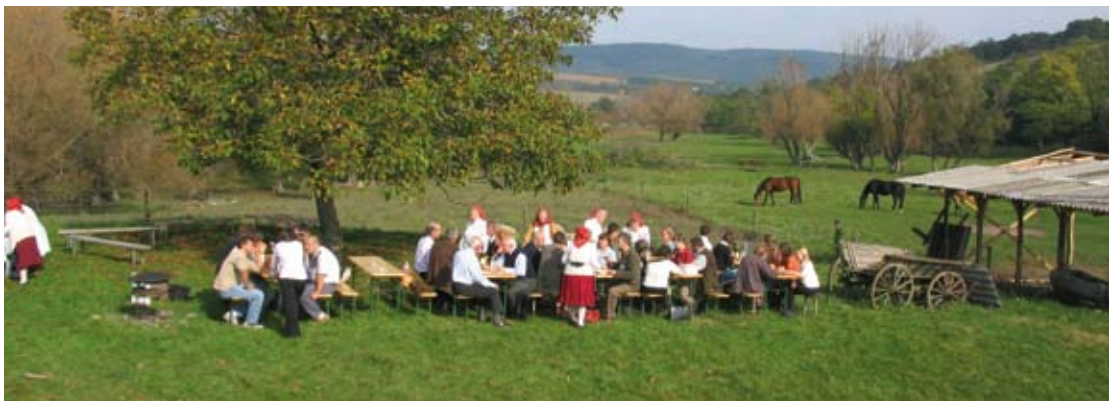
foto: RLG EEAC Conferentie, Europese Plattelandsontwikkeling, Hongarije

Het advies is ondertekend door 15 raden uit 12 landen en gepresenteerd tijdens een werkconferentie van 6-8 oktober in Vac, Hongarije. Tijdens de conferentie belichtten externe deskundigen de plattelandsontwikkeling vanuit sociaal/cultureel, economisch en ecologische perspectief. De Europese Commissie gaf een inleiding over het nieuwe plattelandsontwikkelingsbeleid. Sprekers vanuit verschillende delen van Europa gaven bij de workshops korte toelichtingen op de thema's klimaatverandering, biodiversiteit, Lisbon-proces en regelgeving in relatie tot plattelandsontwikkeling en er werden kernboodschappen opgesteld voor de Europese Commissie en lidstaten. Het advies en de conclusies van de conferentie zijn aangeboden aan vertegenwoordigers van de Hongaarse en Nederlandse overheid. Het advies en de conclusies heeft de raad in oktober gepubliceerd onder de titel 'European Rural Resources at Risk'.