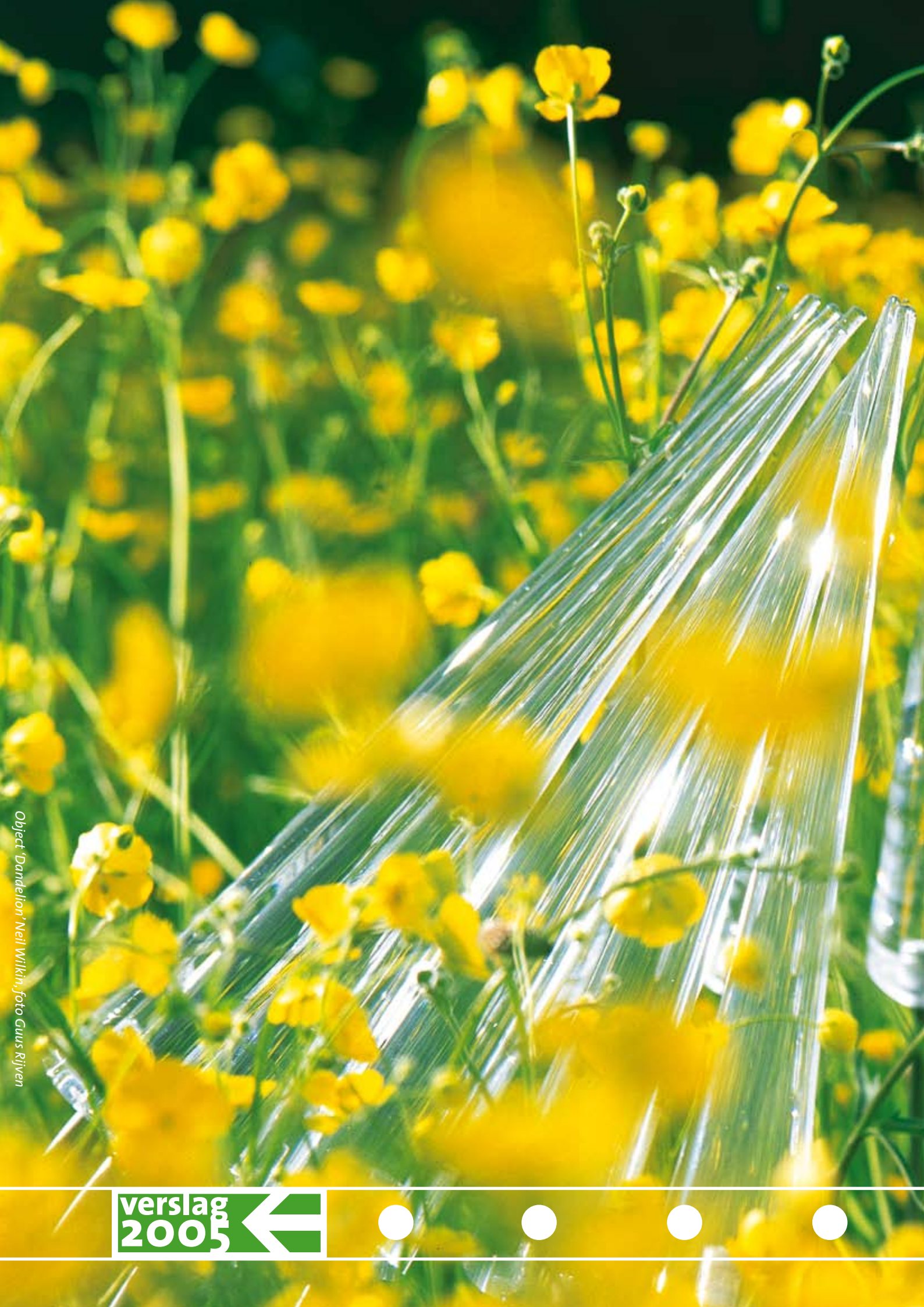
Object 'Dandelion' Neil Wilkin, foto Guus Rijken