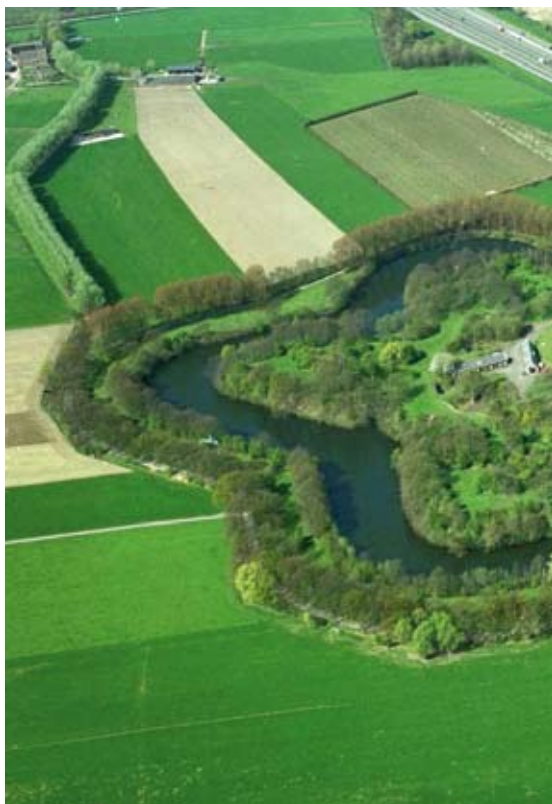
Nieuwe Hollandse Waterlinie, Fort Vechten

De raad schat dat op een oppervlakte van circa 500.000 ha sprake zal zijn van een inrichtingsopgave, beheersopgave of een combinatie daarvan. Voor het realiseren van deze ambitie is veel geld nodig. De raad schat dat er circa 225 miljoen euro per jaar nodig is voor investeringen en beheer. Dat wijkt nogal af van het beschikbare budget van het Rijk. Daarom pleit de raad voor verhoging van het budget en medefinanciering door EU, provincies, gemeenten, maatschappelijke organisaties en de private sector.