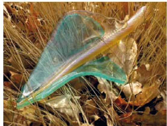
Object 'Glass Leaf' Effie Halkidis

Tevens is een onafhankelijke Gegevensautoriteit voorgesteld die toeziet op de informatie over de verspreiding van soorten. In de leefgebiedenbenadering wordt de regie bij de provincies neergelegd. De raad ziet in deze nieuwe beleidsstrategie zijn belangrijkste aanbevelingen terugkomen, voornamelijk met uitzondering van de aanbeveling op financieel gebied. De financiële gevolgen van het nieuwe beleid worden nu in beeld gebracht.