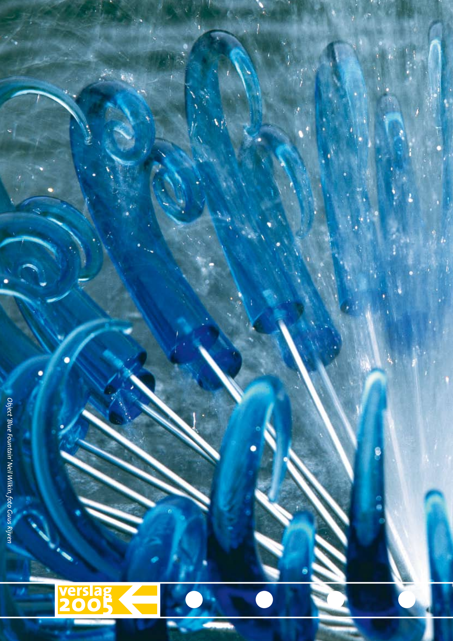
Object 'Blue Fountain' Neil Wilkin, foto Guus Rijken