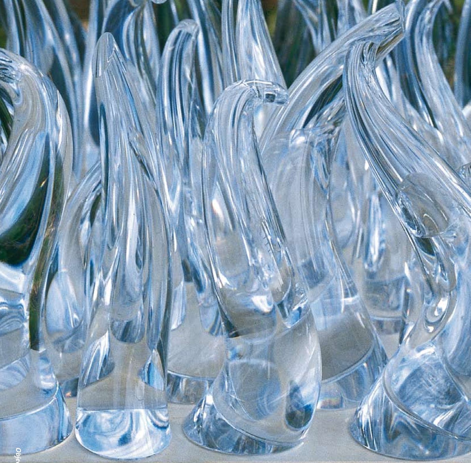
Object 'Hosta 2' Neil Wilkin, foto Taco Anema