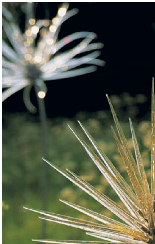
Object 'Gold Seed Head' Neil Wilkin

De raad heeft op 11 maart zijn bijdrage aan het ministerie van BZK toegezonden. Naar aanleiding van alle bijdragen van de verschillende raden heeft er een rondetafelgesprek plaatsgevonden met de plaatsvervangend DG Programma Andere Overheid.