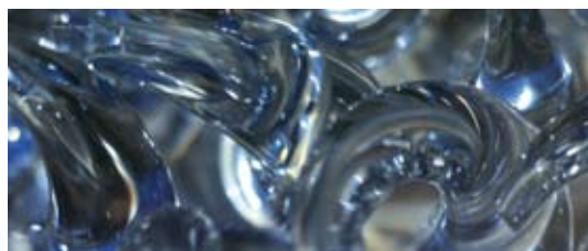
Object 'Hosta 2' Neil Wilkin

Enerzijds is er sprake van een blijvende vraag naar regels en overheidsbemoeienis om onzekerheid de baas te worden. Anderzijds heeft de overheid steeds minder macht en houden mensen zich steeds minder aan de regels. Dit betekent dat er een zoektocht gaande is welke richtingen we uit moeten en op welke wijze we het sociale contract opnieuw vorm kunnen geven. 'Van zorgen voor naar zorgen dat' is in het LNV-beleidsprogramma 'Vitaal en samen' omschreven als het streven naar een overheid die het mogelijk maakt dat maatschappelijke partijen zelf de verantwoordelijkheid kunnen nemen voor de inrichting van hun leven en leefomgeving.