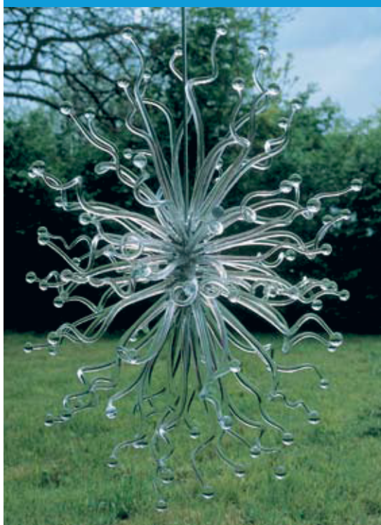
Object 'Snail Eye Chandelier' Neil Wilkin

De adviesopdracht van de Raad voor het Landelijk Gebied luidt als volgt: "De regering en de beide kamers der Staten-Generaal adviseren over strategische beleidsvraagstukken ten aanzien van de functies landbouw, natuur, bos en landschap, openluchtrecreatie en visserij van het landelijk gebied, alsmede strategische vraagstukken die verband houden met dan wel van invloed zijn op die functies, al dan niet in onderlinge samenhang."