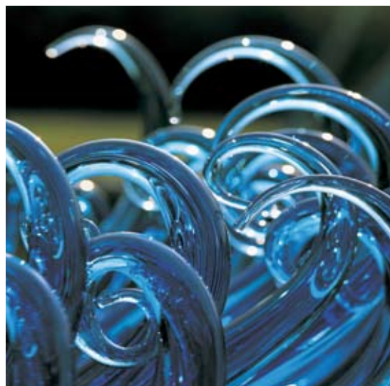
Object 'Blue Fountain' Neil Wilkin