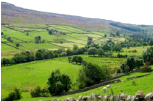
Yorkshire Dales