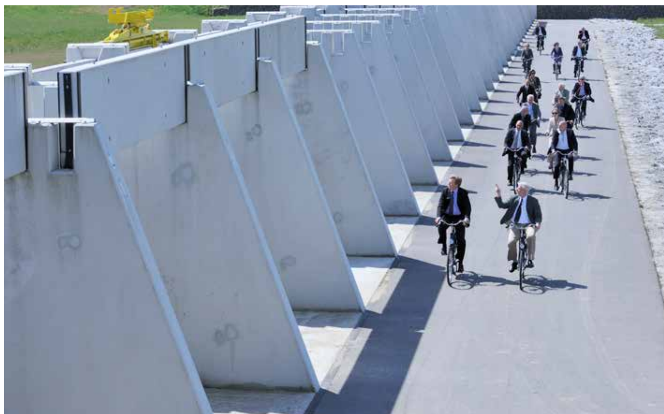
Werkbezoek Hondsbroeksche Pleij ~ 20 05 2010