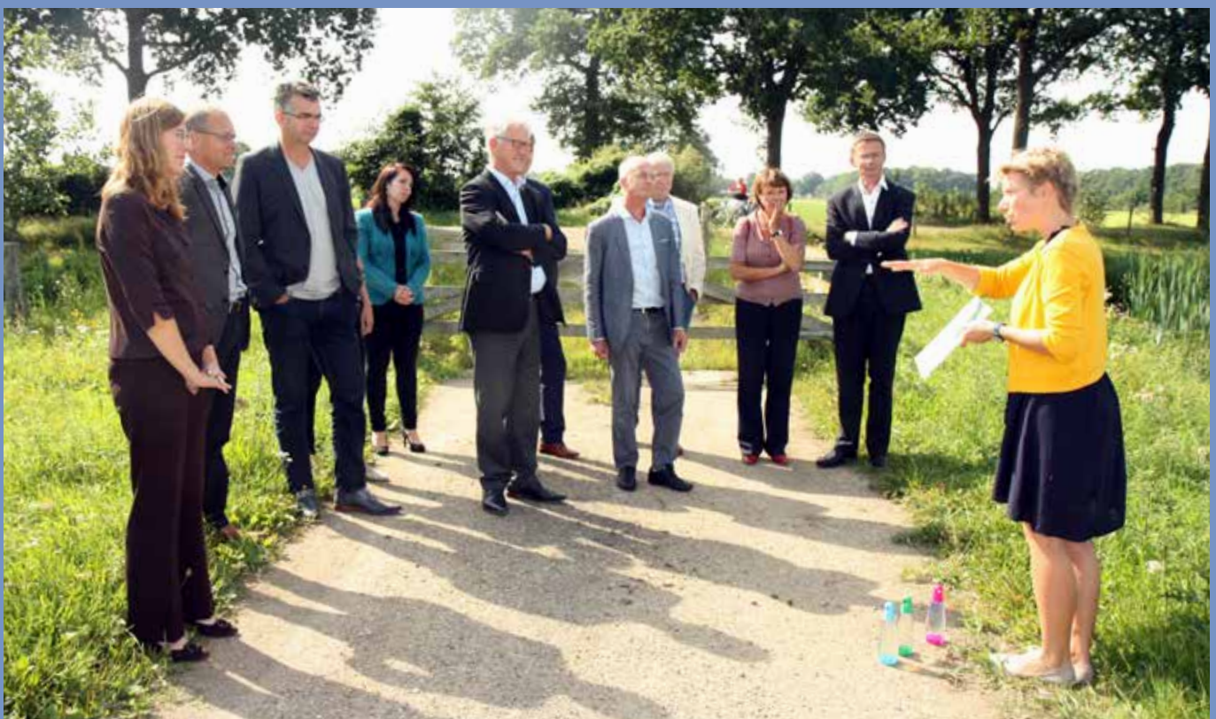
Expertbijeenkomst grondwater Dalfsen ~ 25 08 2017