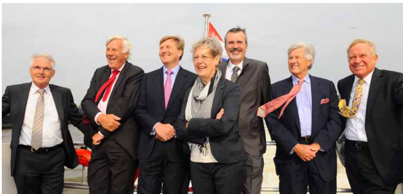
Werkbezoek Munnikenland / Slot Loevestein ~ 15 06 2011