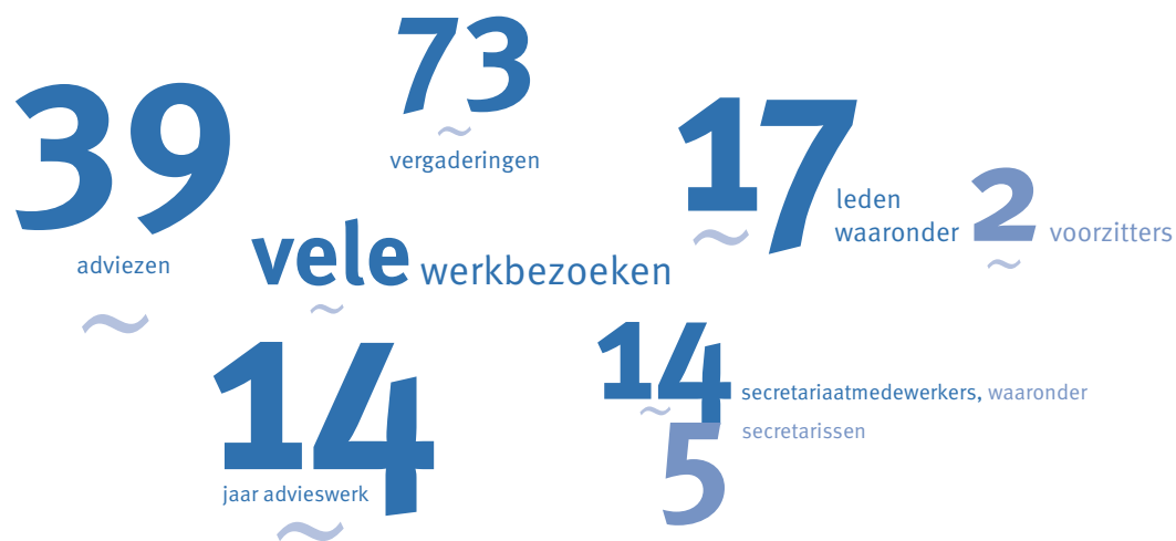
Tabel 3: Overzicht leden van het secretariaat van de Adviescommissie Water