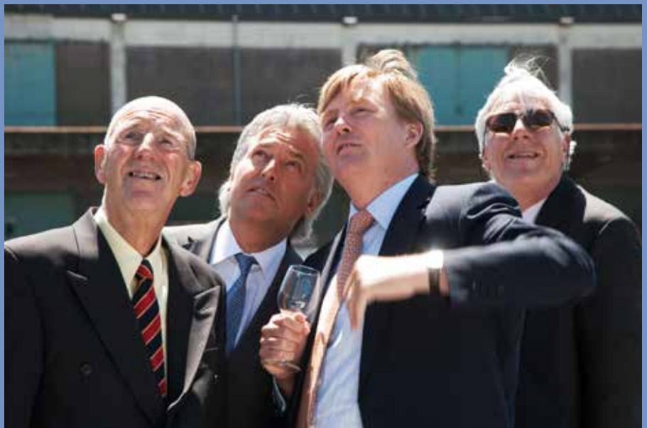
Werkbezoek Rotterdam ~ 02 06 2009