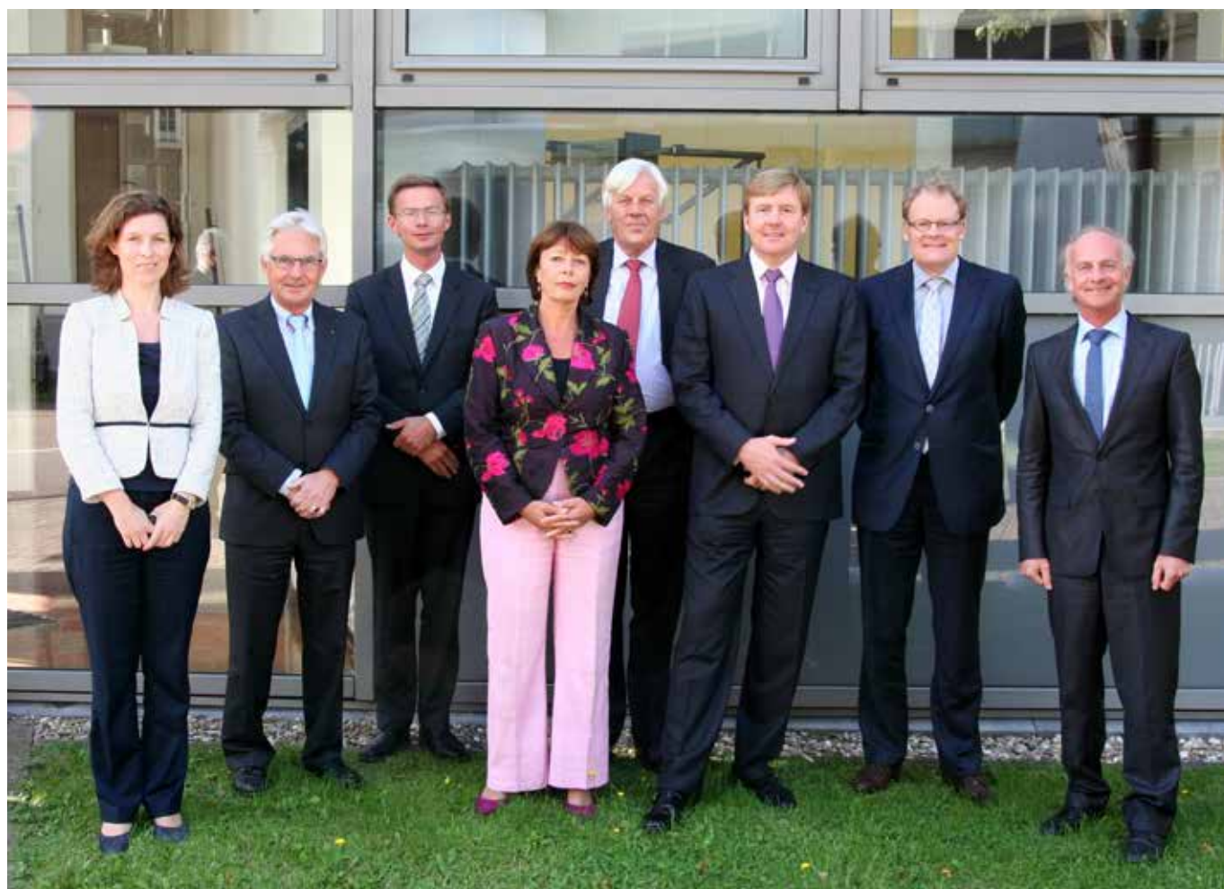
Werkbezoek KNMI ~ 25 09 2012