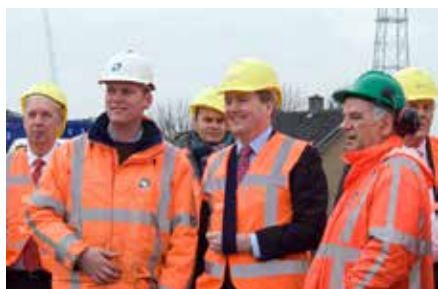
Werkbezoek Lekkerkerk ~ 04 02 2010