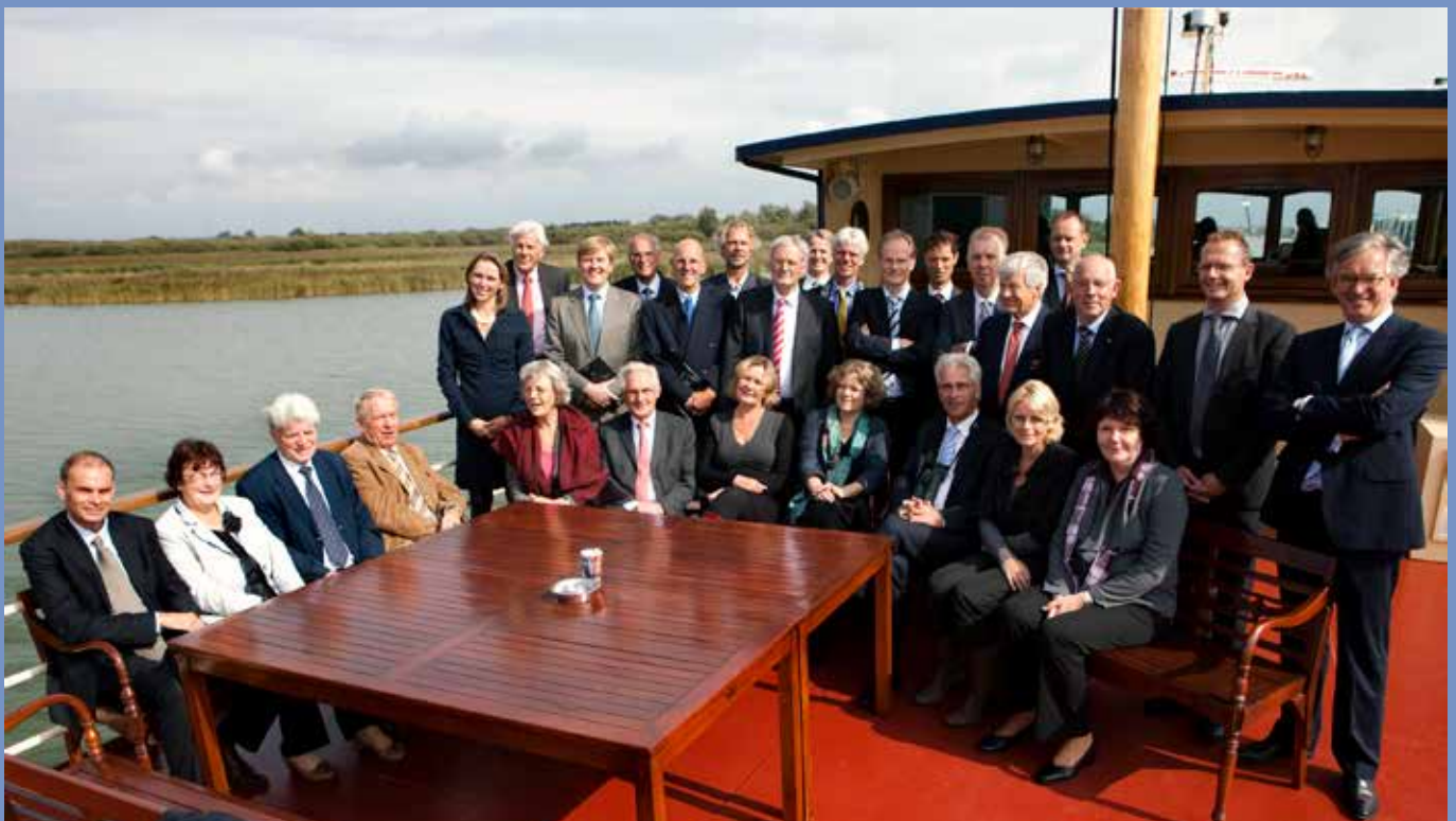
Werkbezoek Afsluitdijk / IJsselmeergebied ~ 09 09 2010

Voorjaar 2017 kwam het laatste advies over het brede waterbeleid uit, en wel over de integrale toetsing van omgevingskwaliteit. De AcW stelde dit advies samen met het College van Rijksadviseurs (CRA) op. De boodschap luidde: zorg voor een goede borging van de beleidsdoelen voor de fysieke leefomgeving, waaronder water. Een sleutelrol hiervoor ligt bij de gemeenten. Volgens de AcW en de CRA zou de inzet van visitatie kunnen helpen om dit te bereiken.