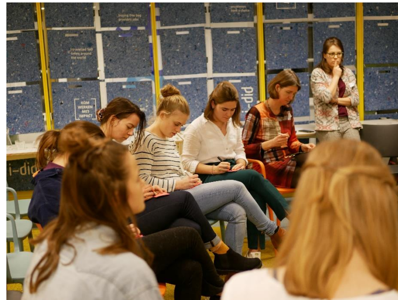
Een sfeer impressie