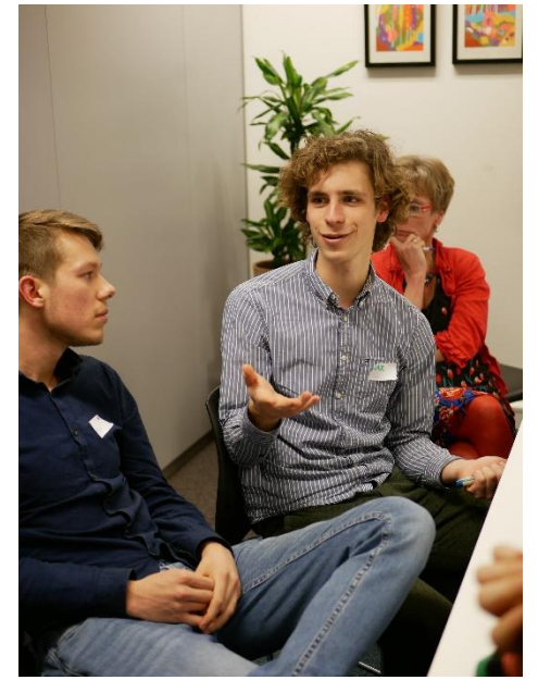
Een sfeer impressie